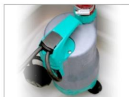
POMPA IMMERSA PROFESSIONALE