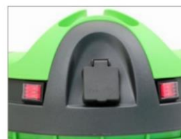
PRESA ALIMENTAZIONE ELETTRICA A BORDO MACCHINA