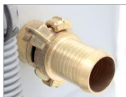
RACCORDO OTTONE PER SCARICO LIQUIDI