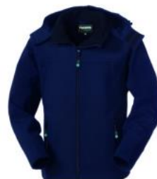
ZX – BLU/NERO

Polsi interni in maglia elastica, fondo posteriore arrotondato, coulisse al fondo del capo.