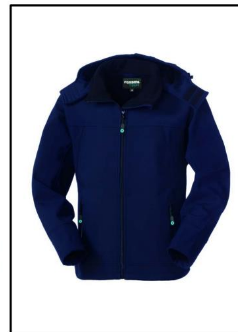
ZX – BLU/NERO