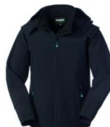
ZY – NERO/GRIGIO